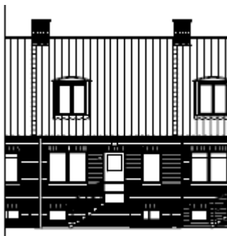
FACADE MOD GADEN

Vi har gennem det sidste halv år arbejdet med arkitektfirmaet Box 25, for at få etableret retningslinjer for vores facader. Retningslinjerne er udført på samme måde som de forgående retningslinjer for tagudskiftning.